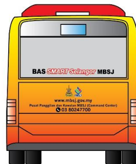
Contoh reka bentuk di bas SMART Selangor Majlis Bandaraya Subang Jaya (Pandangan hadapan dan belakang)