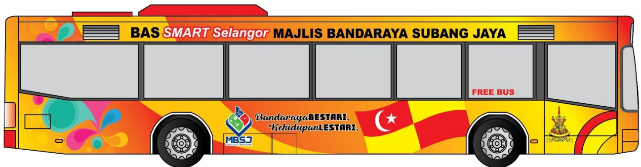
Contoh reka bentuk di bas SMART Selangor Majlis Bandaraya Subang Jaya (Pandangan sisi kanan)