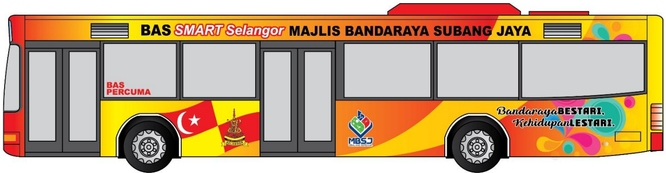
Contoh reka bentuk di bas SMART Selangor Majlis Bandaraya Subang Jaya (Pandangan sisi kiri)